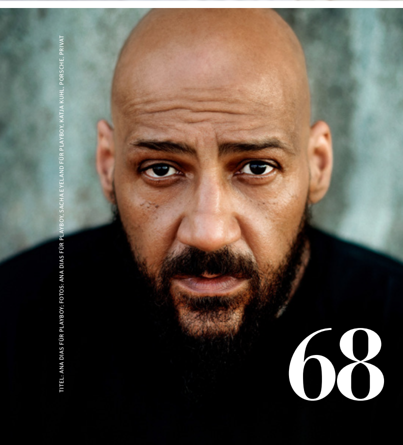
TITEL: ANA DIAS FÜR PLAYBOY; FOTOS: ANA DIAS FÜR PLAYBOY; SACHA EVELAND FÜR PLAYBOY; KATJA KUHL, PORSCHE, PRIVAT